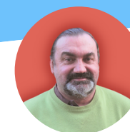
ERIC L. POUR TRANSITION MINETT ASBL

« Quelque part au dessus de l'arc-en-ciel les oiseaux bleus volent », «je vois des arbres verts et des roses rouges aussi, je les regarderai fleurir », «je vois des amis se serrer la main disant comment vas-tu ? », «j'entends les bébés pleurer et je les regarde grandir »,... Ainsi chantait merveilleusement Louis Armstrong en 1967 .